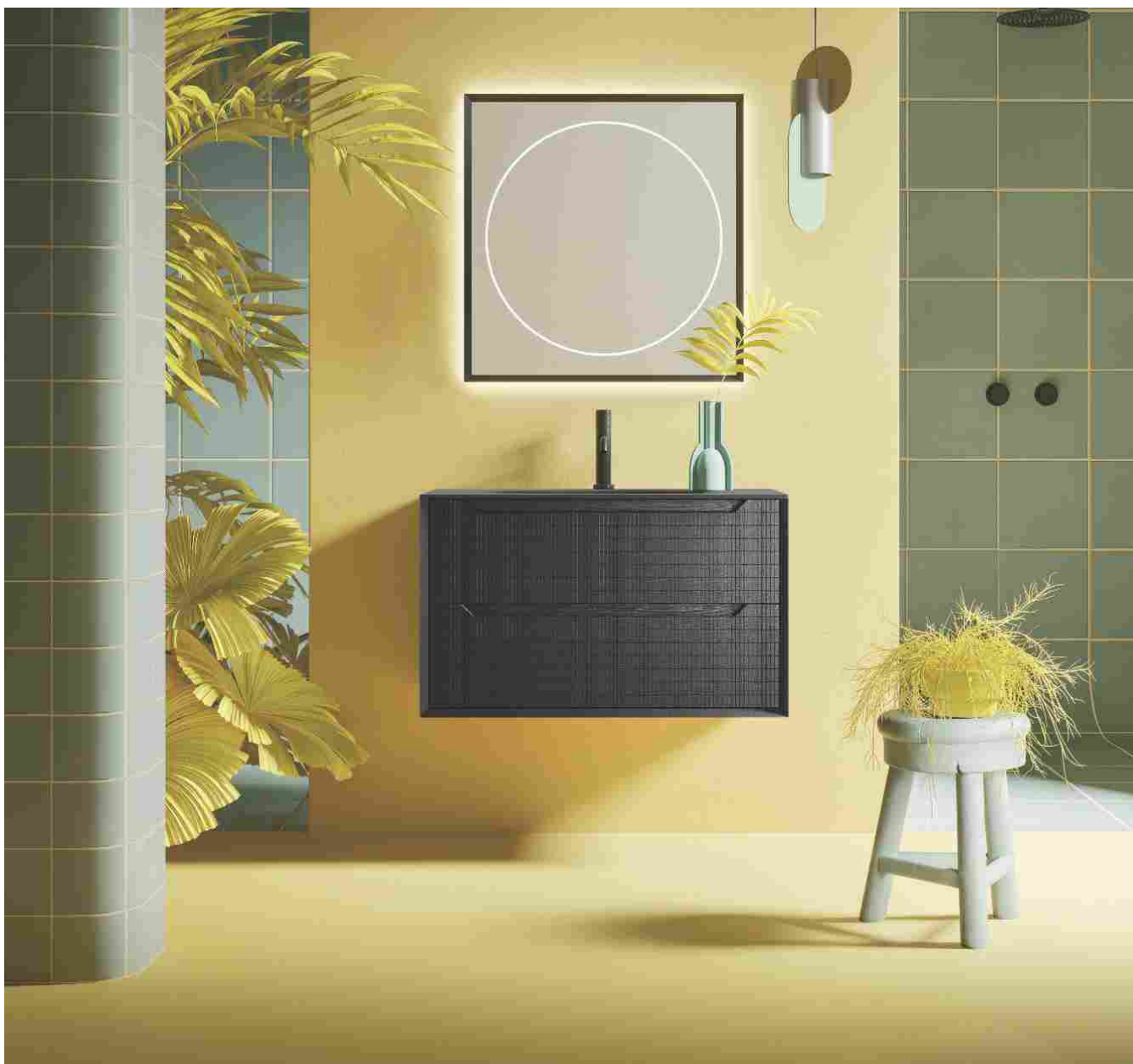
Composizione Master #05 di Arbi Arredobagno: base portalavabo con frontale in Rovere Inchiostro Bricks e struttura in Rovere Inchiostro, abbinata al piano top con lavabo integrato Ovale 57 in solid Glass Nero; specchiera Frame

Un'ampia palette cromatica - composta da 56 tonalità, tra cui 4 nuance metal, a cui si aggiunge il pregiato legno di Rovere - rende la collezione estremamente versatile, adatta a soddisfare ogni gusto e stile di arredo. Questa varietà di opzioni consente, infatti, di creare configurazioni personalizzate, caratterizzate da originali abbinamenti di colore o finiture, tutti arricchiti da texture di grafismi leggeri o calde venature. Una libertà compositiva che dà vita ad ambienti bagno dal forte impatto estetico, dove poter rappresentare l'unicità del proprio modo di essere.