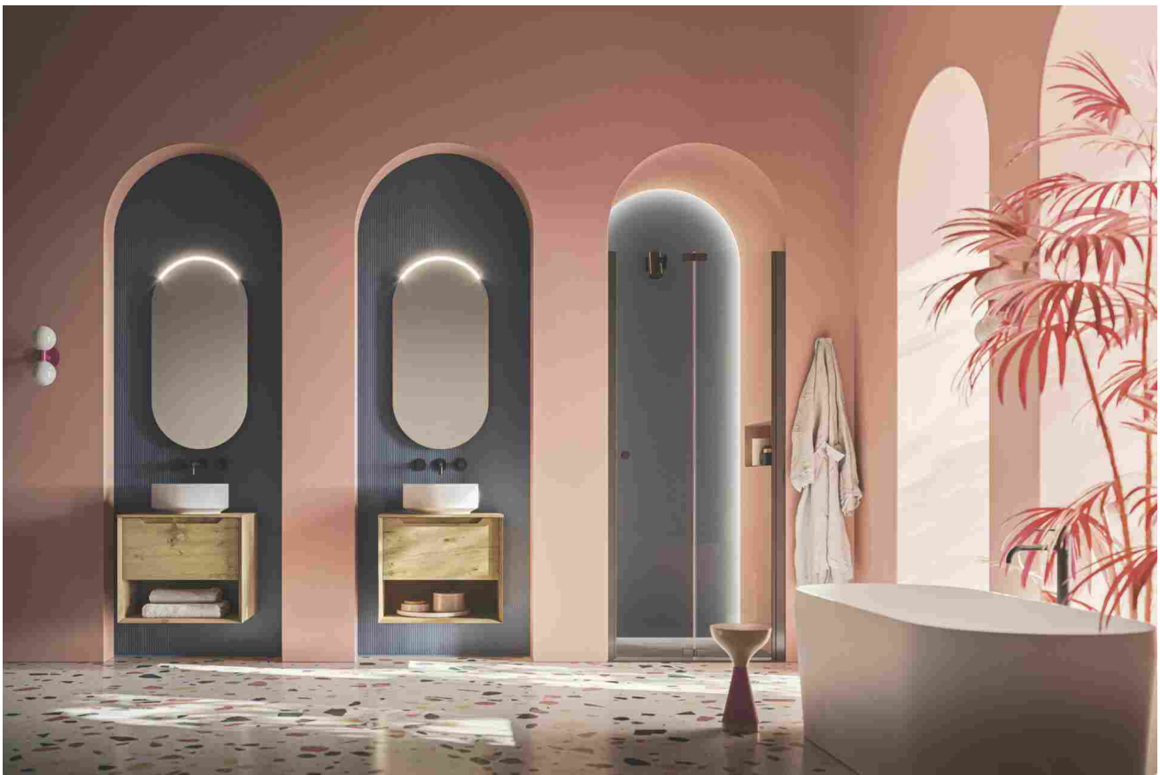
Composizione Master #01 di Arbi Arredobagno: coppia di basi portalavabo in Rovere antico Fieno con lavabi Smart 38 in ceramica bianca; specchiere Olivia con faretto Soleil. Completa l'ambiente bagno la cabina doccia Best

Ogni dettaglio è curato con la massima precisione: dalla particolare lavorazione a 45° che conferisce alla proposta un'aura di sofisticata eleganza alla maniglia integrata che, oltre ad aggiungere un tocco di stile, garantisce una maggiore praticità d'uso.